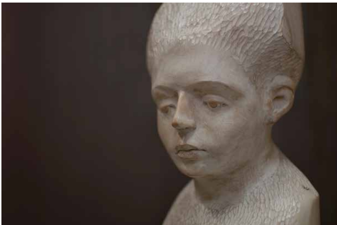
Davide Galbiati The Child (détail)