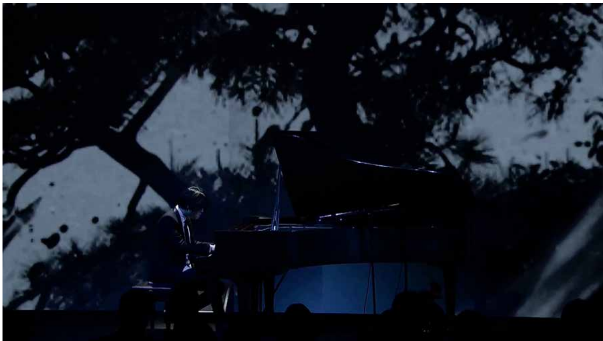
Shun Kawakami Video Installation with Keiichiro Shibuya + 7 shuffles, Reception Party for The Westminster Roppongi at Grand Hyatt Tokyo