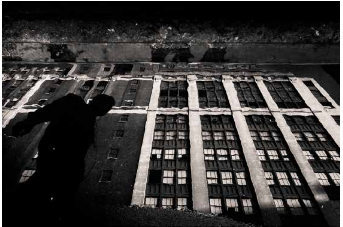
Lo Kee Window(s)