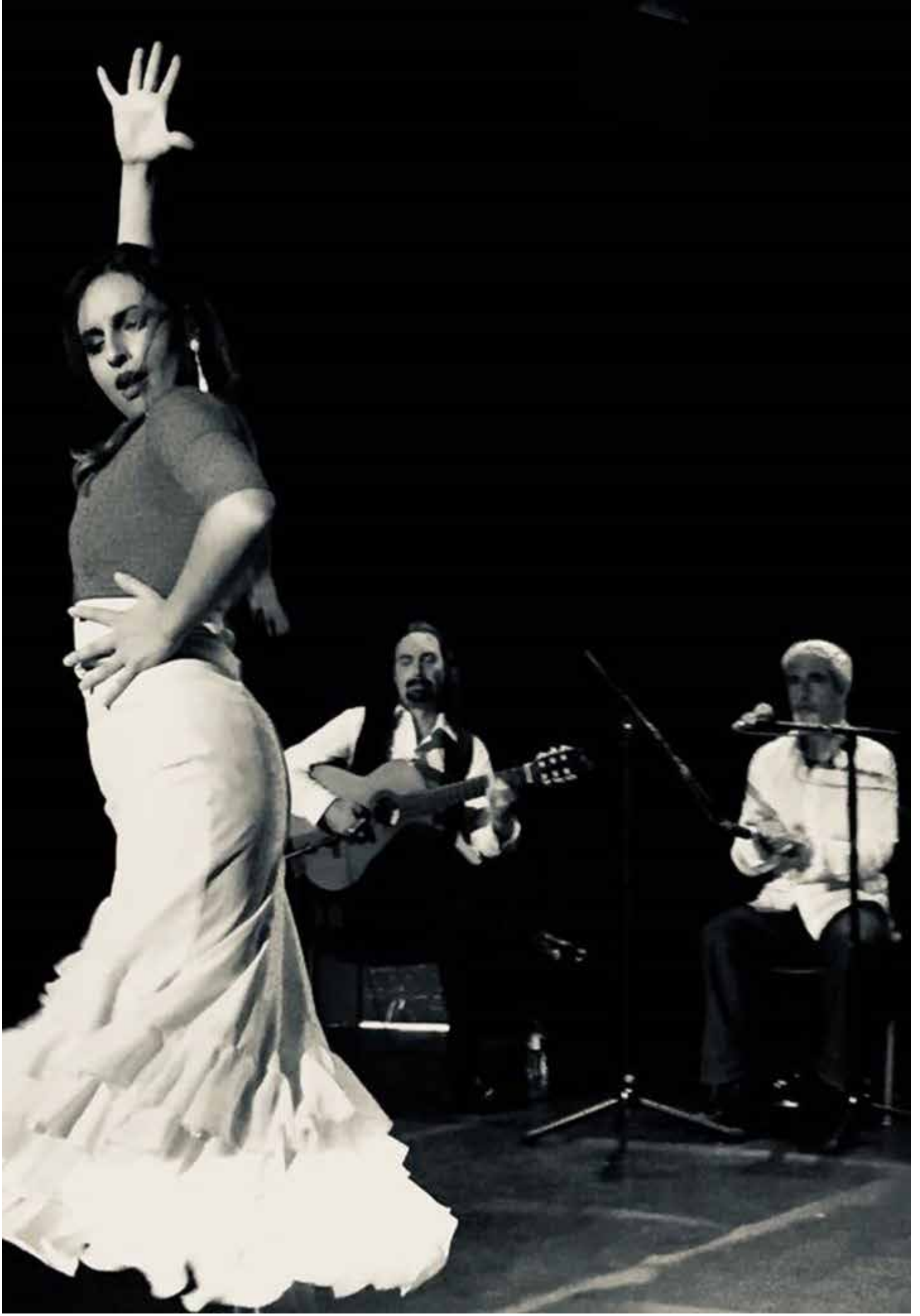
Flakete Flamenko Grand Concert Flamenco