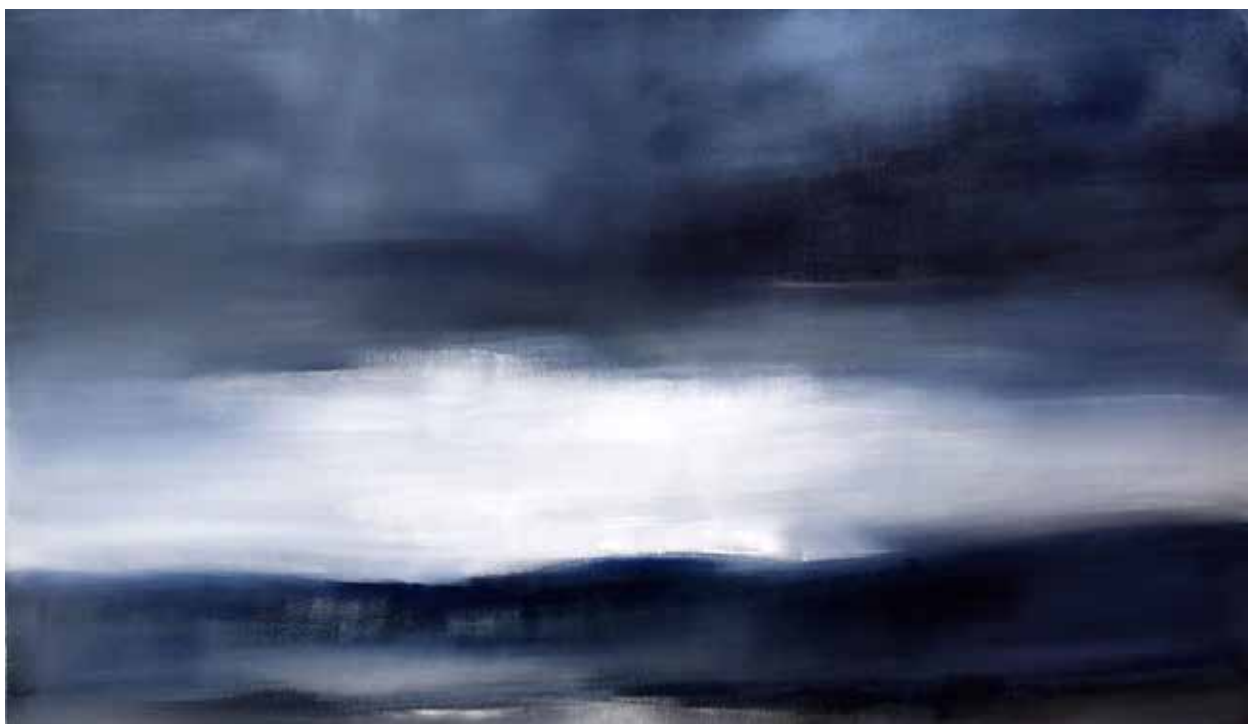
Pascale Benéteau Gros Grain